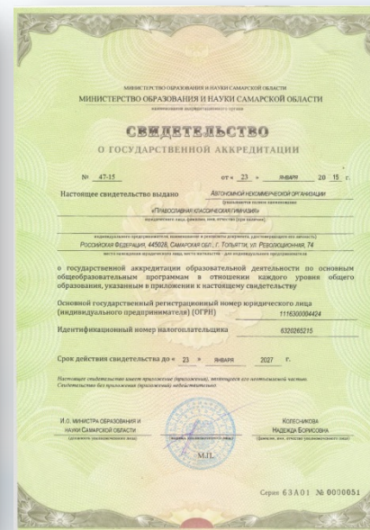
Свидетельство о государственной аккредитации